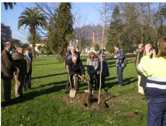
Miembros de Langreanos en el Mundo